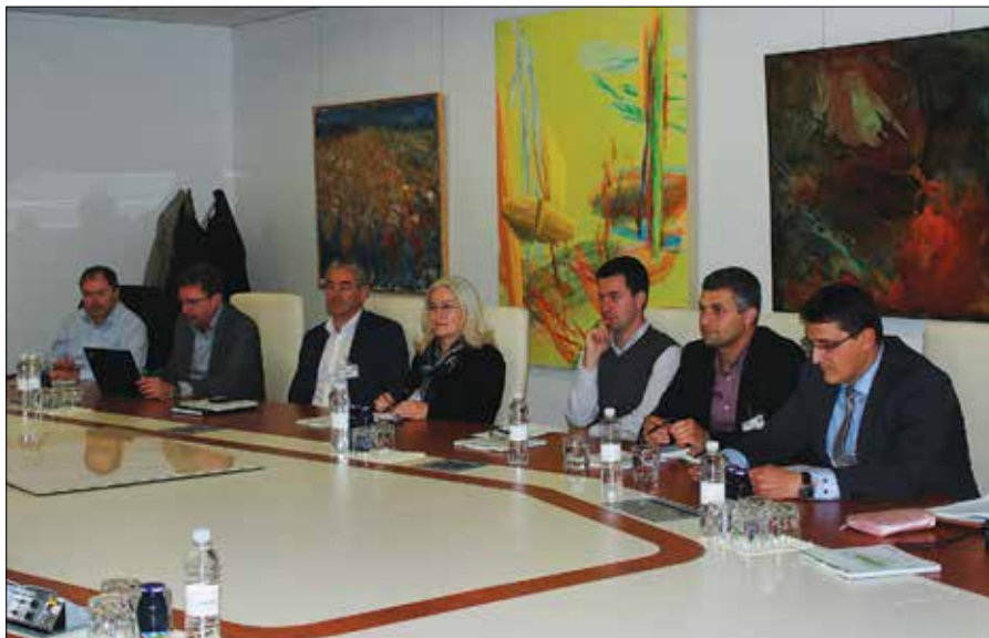
Člani novoizvoljenega upravnega odbora so se strinjali, da je potrebno nadaljevati z uspešnim delovanjem zbornice iz minulega mandata.