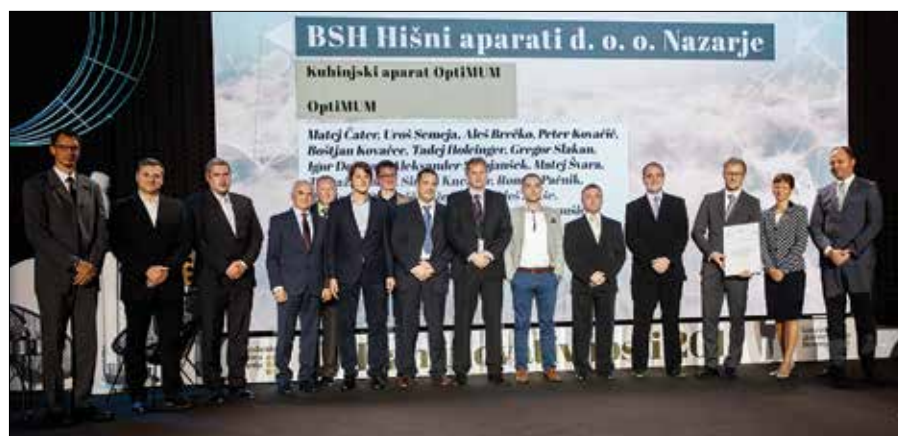
Inovatorji nazarskega podjetja BSH Hišni aparati so prejeli zlato priznanje za kuhinjski aparat OptiMUM.

na dolgi rok ohranjalo prednost pred konkurenti,« je poudaril predsednik države.