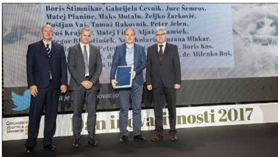
Inovatorji Esotecha so prejeli srebrno priznanje so za sistem obdelave odpadnih vod v termoelektrarni Nikola Tesla A, Obrenovac.

Inovatorje je nagovoril predsednik republike Borut Pahor , ki je dejal, da v njih vidi prihodnost, saj imajo »znanje za sanje«. Pahor je izpostavil, da je inovativno podjetništvo ključni vzvod za rast produktivnosti ter s tem dvig konkurenčnosti slovenskega gospodarstva. »Ravno inovacijska sposobnost je tista, ki omogoča podjetju hitro prilagajanje spremembam, ki se dogajajo v mednarodnem prostoru. Le visoko inovativno podjetje bo lahko