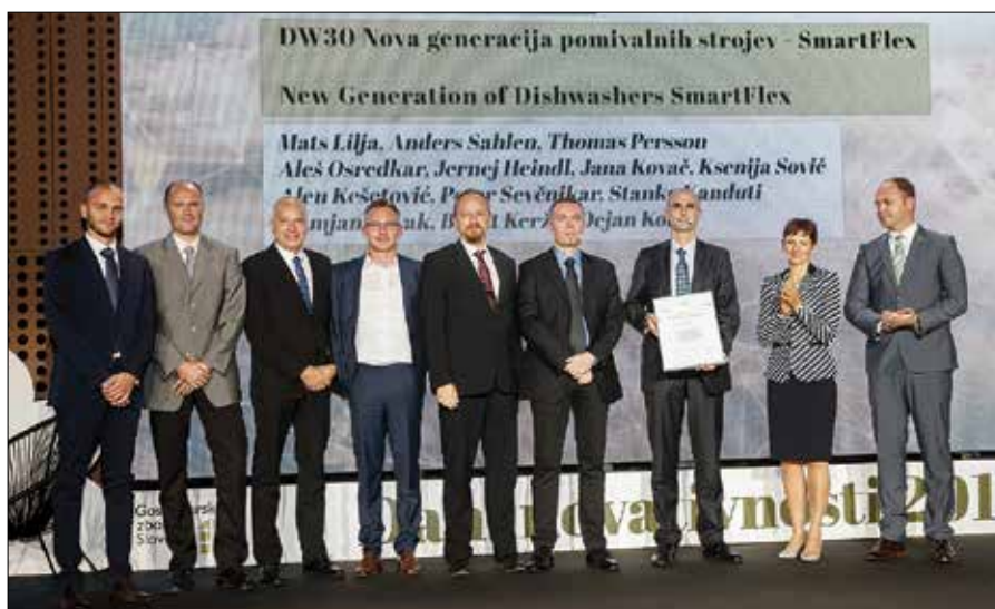
Drugo zlato priznanje je šlo v roke inovatorjev Gorenja za novo generacijo pomivalnih strojev SmartFlex DW30.

V zadnjih petnajstih letih je Gospodarska zbornica Slovenije, vključno z letošnjimi prejemniki, nagradila že več kot 8.400 inovatorjev in več kot 2.580 inovacij. Inovatorji iz SAŠA regije so z letošnjimi dosežki ponovno dokazali, da se uvrščajo v sam vrh slovenske inovativnosti, naša regija pa sodi med vodilne na tem področju.