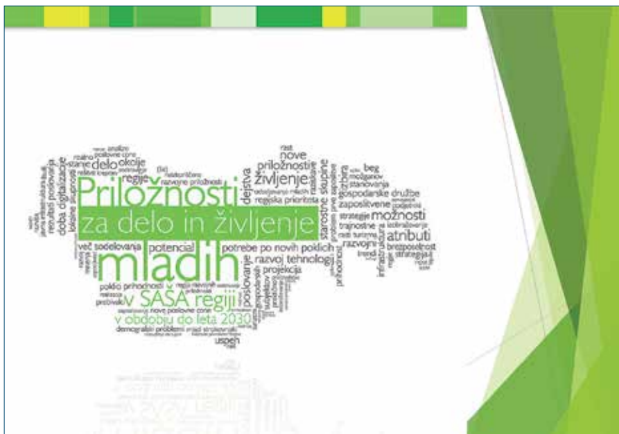
Naslovna stran študije Priložnosti za delo in življenje mladih v SAŠA regiji v obdobju do leta 2030

V Javnem zavodu Center za razvoj terciarnega izobraževanja (CRTI) SAŠA Velenje, v katerem aktivno sodeluje tudi Savinjsko-šaleška gospodarska zbornica, je bila zato sprejeta odločitev, da se izvede raziskava z naslovom Priložnosti za delo in življenje mladih v SAŠA regiji v obdobju do leta 2030. Delo je v okviru vsebine projektne naloge potekalo v devetih