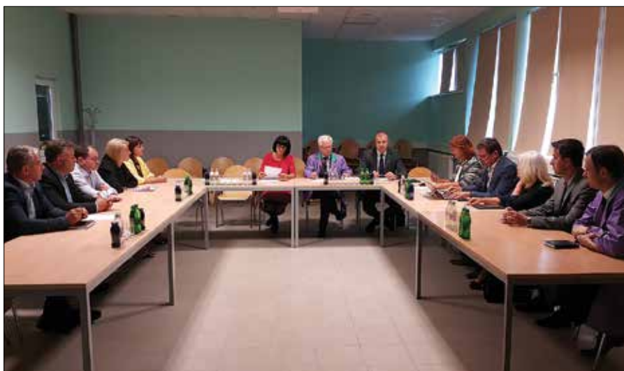
Upravni odbor je podprl v vladnem zakonu predviden način financiranja železniške infrastrukture tudi zato, ker bo tako ostalo več denarja za 3. razvojno os.

Brez uveljavitve zakona bi bila uresničitev projekta odložena za več let, v tem času pa bi nas transportne poti obšle prek sosednjih držav. Če ne bo prišlo do načrtnega in sistematičnega prenosa večjega dela rastočega prometa tovora na železnice, bodo že v roku de-