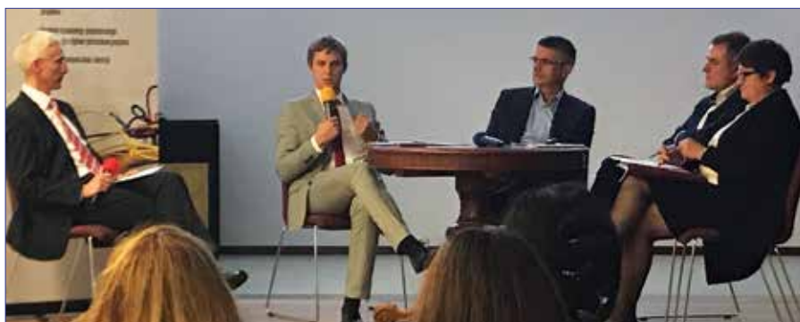
Udeleženci okrogle mize so se strinjali, da prekomerna davčna obremenitev negativno vpliva na konkurenčnost gospodarstva.